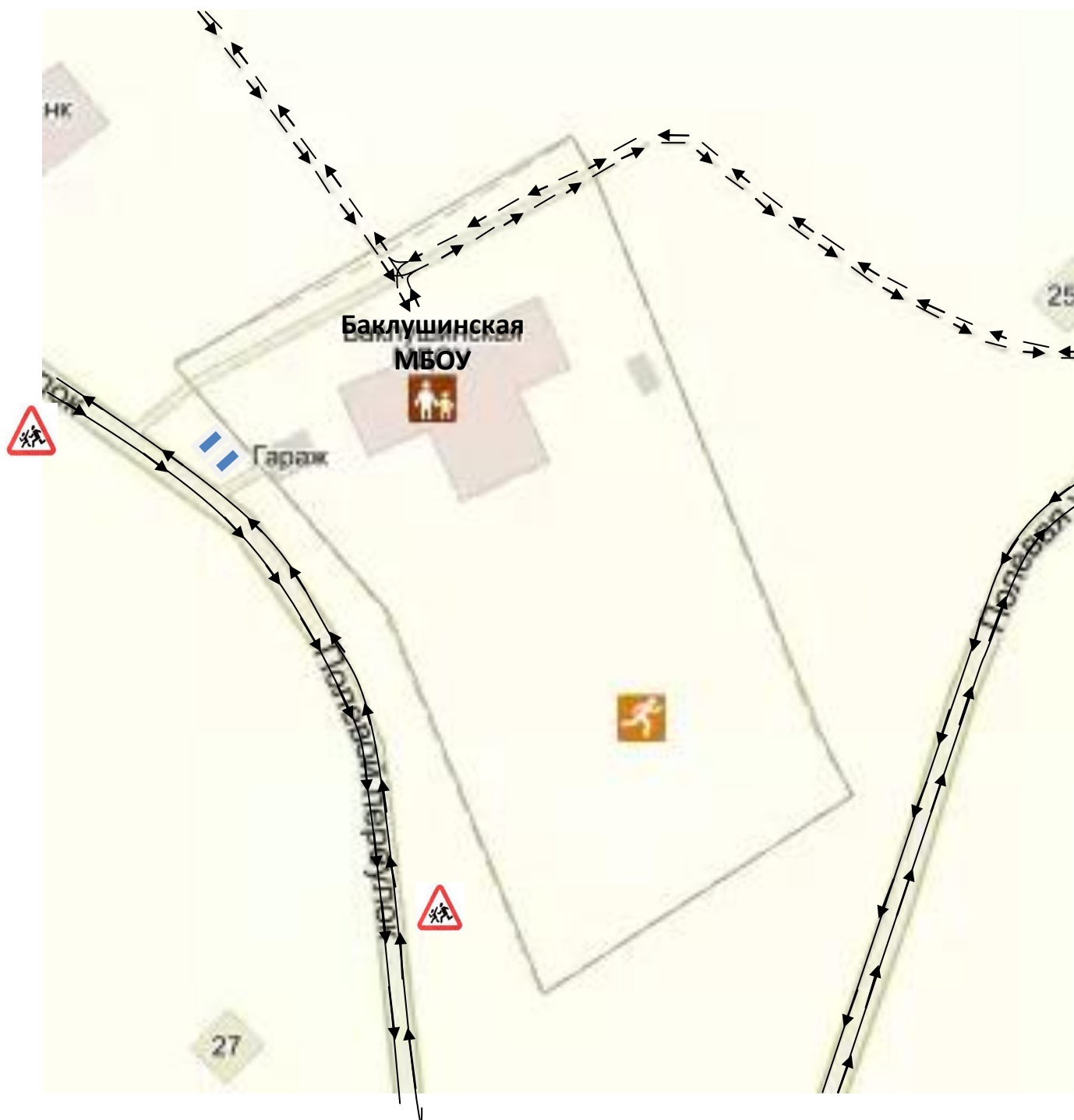
Схема организации дорожного движения в непосредственной близости от образовательного учреждения с размещением соответствующих технических средств, маршруты движения детей и расположение парковочных мест